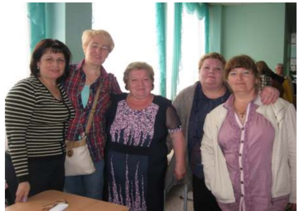
На фото колишні студенти групи 26 М (випуск 1987 року)

Традиційною під час концерту є перекличка випускників – їх цього року відвідало коледж аж 200 осіб, представники 75-ти груп. У залі змогли побачитись і привітати один одного ті вихованці, що отримали диплом нашого закладу 5, 20, 35 – 45 років тому. Найбільше зала аплодувала випускникам 1987 року, які відсвяткували 30-річчя від дня випуску.